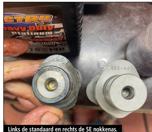
Links de standaard en rechts de SE nokkenas.