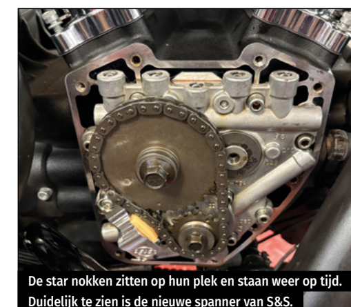
De star nokken zitten op hun plek en staan weer op tijd. Duidelijk te zien is de nieuwe spanner van S&S.