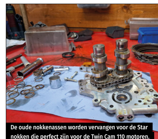
De oude nokkenassen worden vervangen voor de Star nokken die perfect zijn voor de Twin Cam 110 motoren.