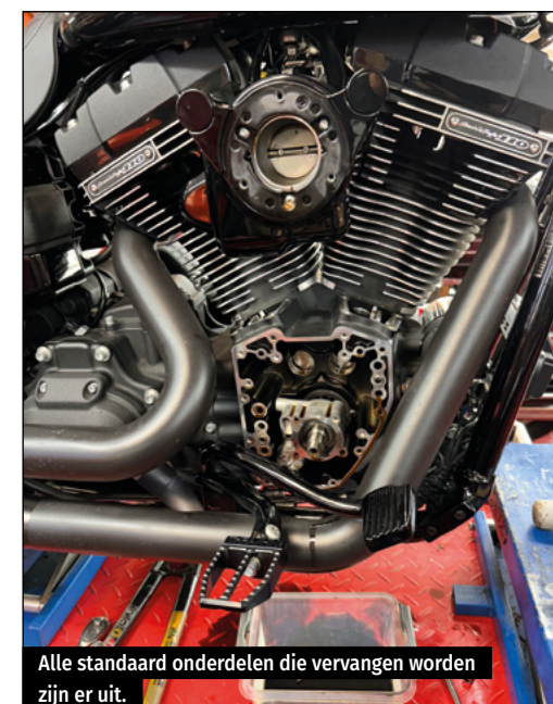
Alle standaard onderdelen die vervangen worden zijn er uit.