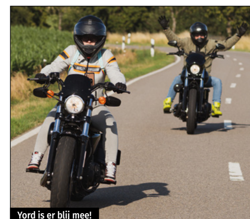
Yord is er blij mee!

een set Star nokkenassen, een set lagers, nieuwe spanners en een set stoterstangen zijn we er klaar voor.