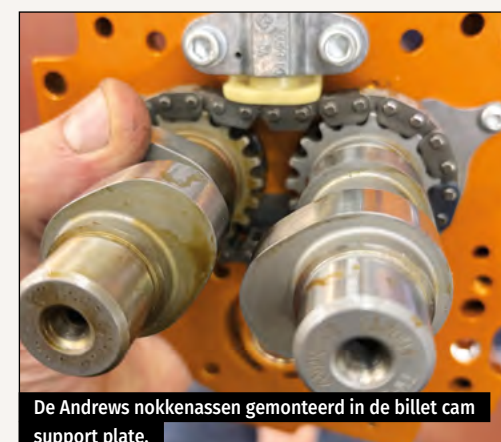
De Andrews nokkenassen gemonteerd in de billet cam support plate.