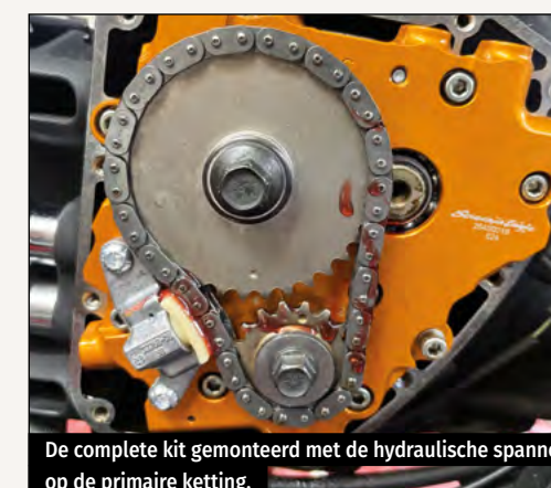
De complete kit gemonteerd met de hydraulische spanner op de primaire ketting.