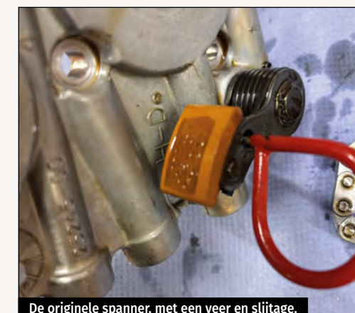
De originele spanner, met een veer en slijtage.