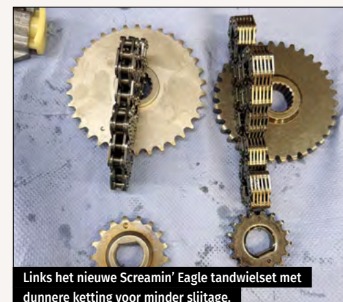
Links het nieuwe Screaming Eagle tandwielset met dunner ketting voor minder slijtage.

Met een km. stand van 55.000 kun je er zeker van uitgaan dat de spanners eruit moeten en waarschijnlijk is dat zelfs al de tweede keer. Dan heb je wel de keuze om er wat mee te doen. Je kunt ze uiteraard gewoon vervangen, wat de goedkoopste optie is. Twee spanners erin, mid-dagje sleutelen en klaar. Je kan ook denken aan tandwielen i.p.v. kettingen maar het gevaar daarvan is dat de meeste krukassen van Harley nogal wat slingeren aan het uiteinde en daar zit nou net het tandwiel. Een tandwiel kan maar weinig slingering hebben zeg maar, een ketting kan dit wel en daarom zit die er ook in. Screaming Eagle maakt een mooie kit, een hybride set zeg maar. Je krijgt een nieuwe cam support pla-