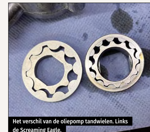
Het verschil van de oliepomp tandwielen. Links de Screaming Eagle.