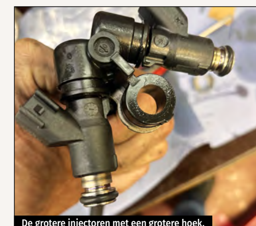
De grotere injectoren met een grotere hoek.

'MET EEN KM. STAND VAN 55.000 KUN JE ER ZEKER VAN UITGAAN DAT DE SPANNERS ERUIT MOETEN EN WAARSCHIJNLIJK IS DAT ZELFS AL DE TWEDE KEER.'