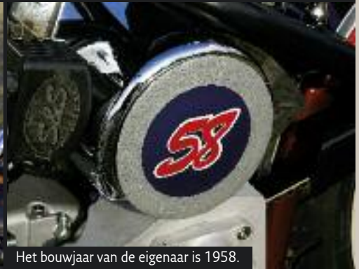
Het bouwjaar van de eigenaar is 1958.

Hobby's: motorrijden en vakantie, liefst in combinatie Huidige motor: Heritage 96", Electra Police, Boze Wolf Droommotor: 'Roodkapje' maar die moet nog gebouwd worden Kilometers per jaar: 25.000 gemiddeld Gebruikt 'm voor: Ride Outs met club (HOG Amsterdam) Favoriete auto: Porsche 911 Vakantieland: Amerika Lekkerste eten: brood Film: Swordfish TV-Programma: Dark Blue Drankje: rode wijn Muziek: Earth Wind & Fire en oude Soul Dagelijks leven: directeur Rosa Security Gezinsleven: getrouwd, de motoren zijn de kindjes Leeftijd: 50 Leukste momenten: mijn trouwerij en 50e verjaardag Pijnlijkste moment: overlijden moeder