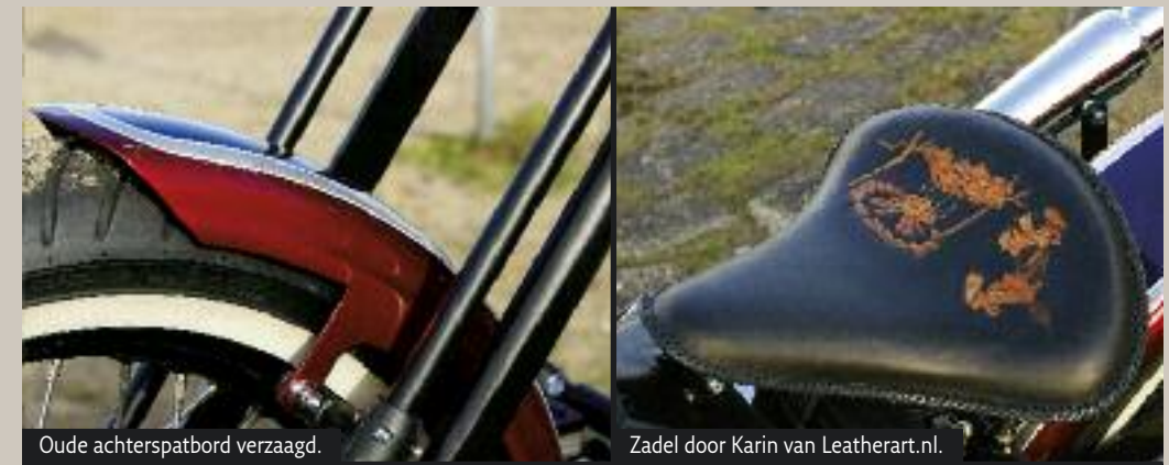
Oude achterspatbord verzaagd.

“Moet je doen, dat is pas een leuk cadeau voor je verjaardag”