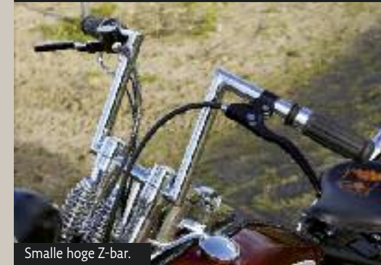
Smalle hoge Z-bar.