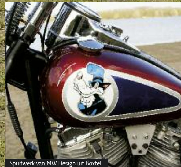
Spuitwerk van MW Design uit Bostel.